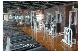
トレーニングジム