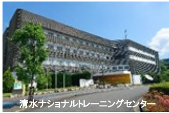
清水ナショナルトレーニングセンター